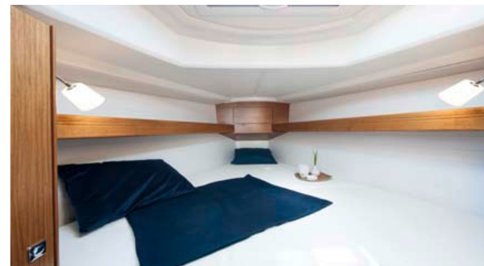
← Luksuz v lastniški kabini.