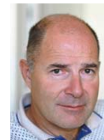
TOMAŽ KUNAVER TTY d. o. o.

Bavaria cruiser 33 je nadomestila več kot uspešno 32-ico. Od nje je podedovala prostornost, ki jo je še nadgradila z večjimi volumni, tako v prednji kabini, kakor tudi v salonu in zadnji spalnici kabini. Večje so tudi postelje. V kabini so dodali panoramska okna, ki prepuščajo več svetlobe in s tem naredijo notranost še svetlejšo in prijaznejšo. Ogromna razlika je vidna v kokpitu, saj je bavaria cruiser 33 prva jadrnica te velikosti, kjer lahko gredo uporabniki normalno okoli krmilnega kolesa, kokpit pa je kljub temu ohranil svojo funkcionalnost. Jadrnalne lastnosti so izboljšali z višjim jamborom oziroma posledično večjo površino jader. V razredu jadrnic z dolžino pod desetimi metri nudi zares veliko in je v teh kriznih časih primerna za vsakega lastnika, ki si želi jadranja po Jadranu ali celo Mediteranu.