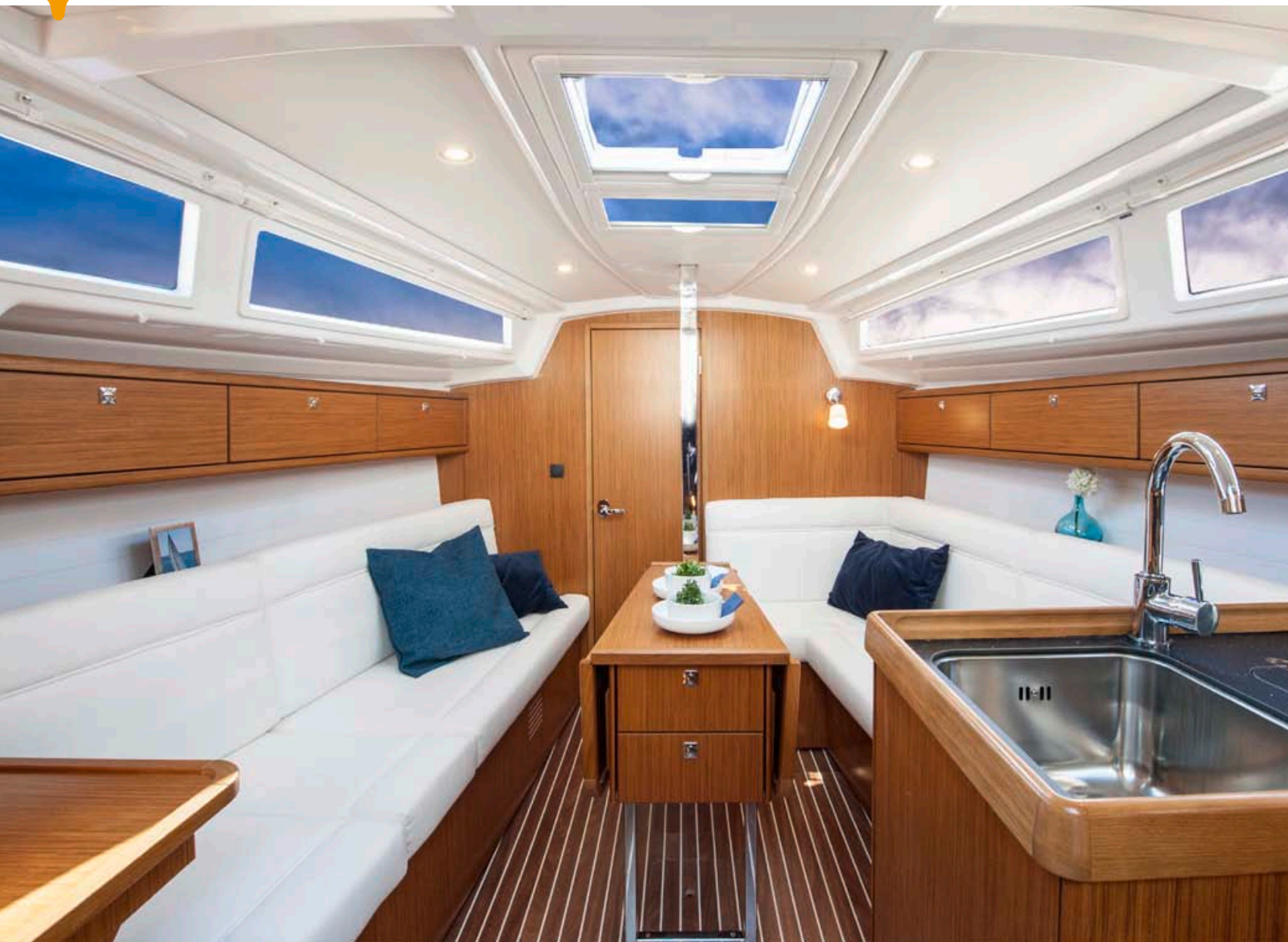
Prostora kokpita s prehodom po desni.