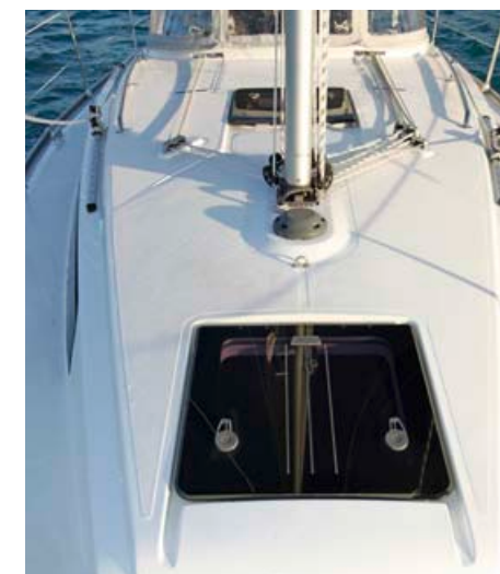
Stropna okna so v nivoju palube.