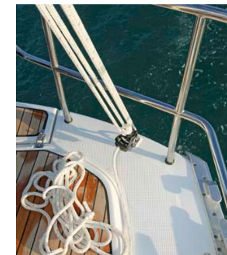
Napetost krmne pripone nastavljamo s pomočjo škripca.