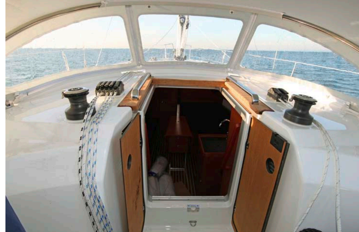
← Vrat v notranjost ne bo treba pospravljati, saj so krilna.