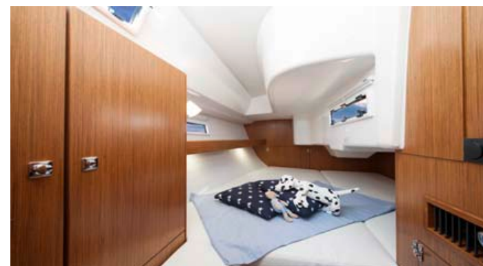
← Ležišči v krmni kabini sta lahko tudi ločeni.